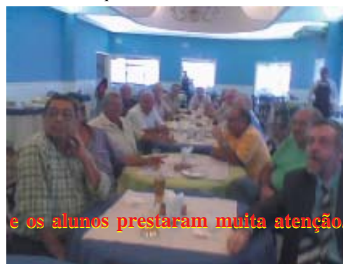
e os alunos prestaram muita atenção.